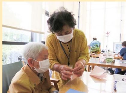
ボランティア活動