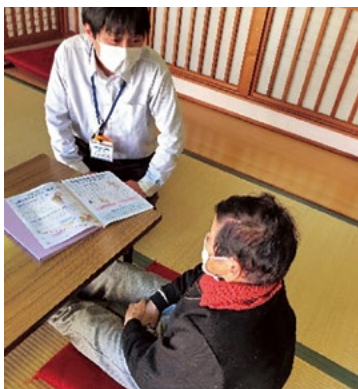
個々に応じた健康指導を実施