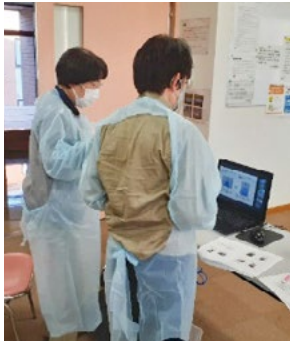
防護服の着脱演習

前半は新型コロナウイルス感染症とその他の感染症の知識や、感染予防・発生時の対応の仕方について学びました。後半は実際に防護服を使用し、正しい着脱の訓練を行いました。